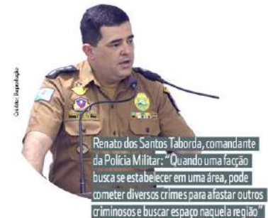
Renato dos Santos Taborda, comandante da Polícia Militar: “Quando uma facção busca se estabelecer em uma área, pode cometer diversos crimes para afastar outros criminosos e buscar espaço naquela região”

De acordo com Taborda, a chegada de novos traficantes a uma determinada região impulsiona a prática de diversos outros delitos, como furto, roubo, homicídio e receptação. “Quando um grupo criminoso busca se estabelecer em uma área, pode cometer diversos crimes para afastar outros criminosos e buscar espaço e autonomia naquela região, incluindo assassinatos”, aponta.