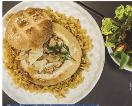
Para o almoço, o Domein oferece opções como stroganoff servido no pão italiano, bife à parmegiana e diversos pratos feitos a partir de combinações saborosas

O brunch, uma mistura ideal entre café da manhã e almoço, está sendo servido em formato de buffet livre aos sábados e domingos. Além disso, o almoço, que já se consolidou no espaço, apresenta agora opções de stroganoff servido no pão italiano, bife à parmegiana e diversos pratos a partir de combinações saborosas. E o melhor de tudo: a preços acessíveis.