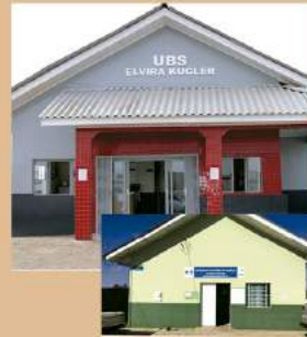
UBS VILA ROSÁRIO ANTES E DEPOIS

PAVIMENTAÇÃO: CASTRO CONTA COM ÁREA URBANA QUASE 100% ASFALTADA