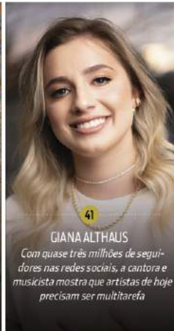
41 GIANA ALTHAUS Com quase três milhões de seguidores nas redes sociais, a cantora e musicista mostra que artistas de hoje precisam ser multitarefas