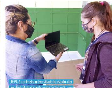
UEPG é a primeira universidade do estado a ter uma Pró-Reitoria de Assuntos Estudantis, que acompanha a qualidade de vida dos acadêmicos