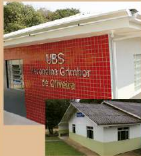
UBS CANTAGALO ANTES E DEPOIS