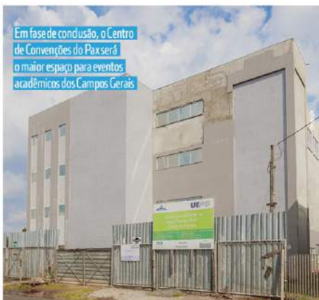
Em fase de conclusão, o Centro de Convenções do Pax será o maior espaço para eventos acadêmicos dos Campos Gerais

Somente em obras, foram executados, entre 2018 e 2021, mais de R$ 7,5 milhões, desde a construção de grandes complexos até projetos menores, como a reforma de laboratórios, a pintura dos prédios e a instalação de equipamentos de ar-condicionado e multimídia nas salas de aula.