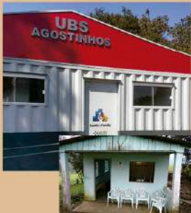
UBS AGOSTINHOS ANTES E DEPOIS

SAÚDE: TODOS OS POSTOS DE SAÚDE DE CASTRO FORAM REFORMADOS OU AMPLIADOS