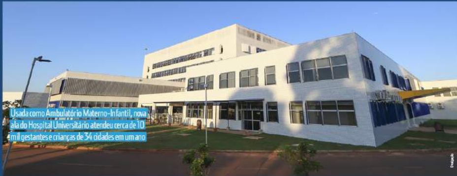
Usada como Ambulatório Materno-Infantil, nova ala do Hospital Universitário atendeu cerca de 10 mil gestantes e crianças de 34 cidades em um ano

Outra grande mudança na Universidade foi a incorporação do Hospital Universitário Materno-Infantil (Humai), antigo Hospital da Criança. Inicialmente, o convênio transferia os serviços de maternidade e pediatria do HU, para liberar espaço para novos leitos de COVID-19. Em setembro de 2021, aconteceu a incorporação definitiva do Humai à UEPC, ampliando programas de Residência Médica e Multiprofissional e abrindo especialidades de alta complexidade que atendem a 28 municípios, com cerca de R$ 1,1 milhão de habitantes.