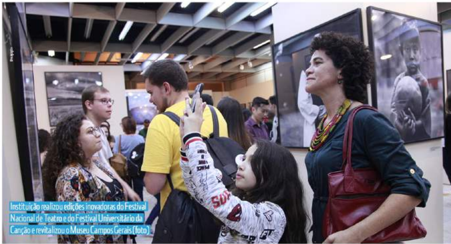
Instituição realizou edições inovadoras do Festival Nacional de Teatro e do Festival Universitário da Canção e revitalizou o Museu Campos Gerais (foto)