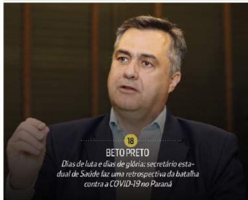
18 BETO PRETO Dias de luta e dias de glória: secretário estadual de Saúde faz uma retrospectiva da batalha contra a COVID-19 no Paraná