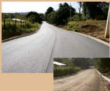
RUA DACIO LEONEL DE QUADROS ANTES E DEPOIS

PAVIMENTAÇÃO: CASTRO CONTA COM ÁREA URBANA QUASE 100% ASFALTADA