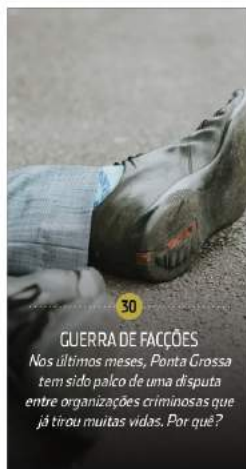
30 GUERRA DE FACCÕES Nos últimos meses, Ponta Grossa tem sido palco de uma disputa entre organizações criminosas que já tirou muitas vidas. Por quê?