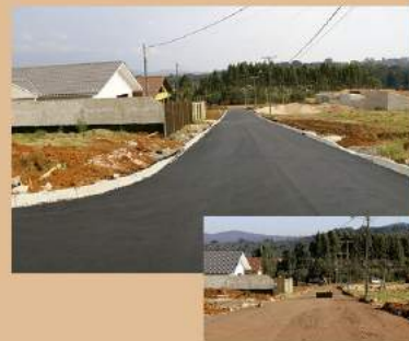
RUA DO JARDIM TERMAS RIVIERA ANTES E DEPOIS