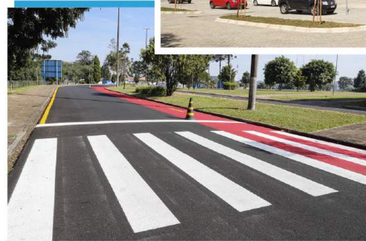
Mais estrutura: ar-condicionado nas salas, reforma do estacionamento no Campus Centro e recapeamento do asfalto no Campus Uvaranas